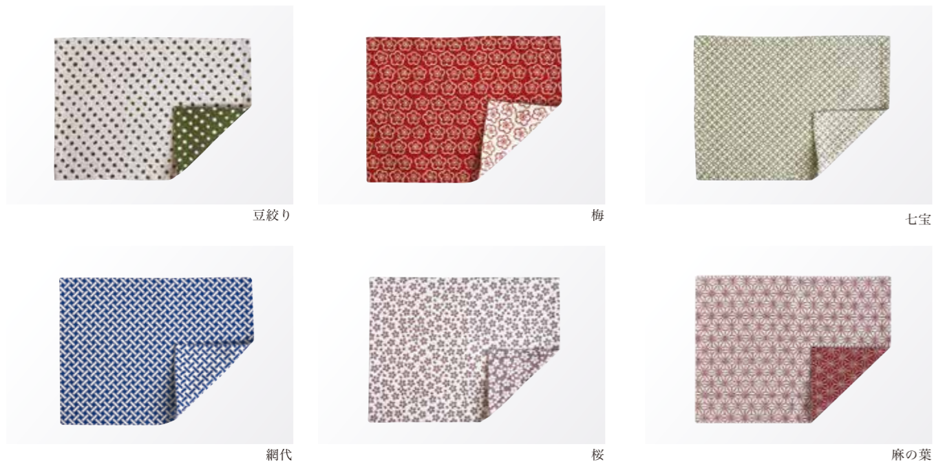
豆絞り 梅 七宝 網代 桜 麻の葉