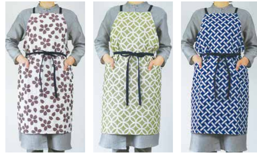
桜 七宝 網代

エプロン ワンサイズ 綿 100% 税込 7,700 円 ( 本体価格 7,000 円 )