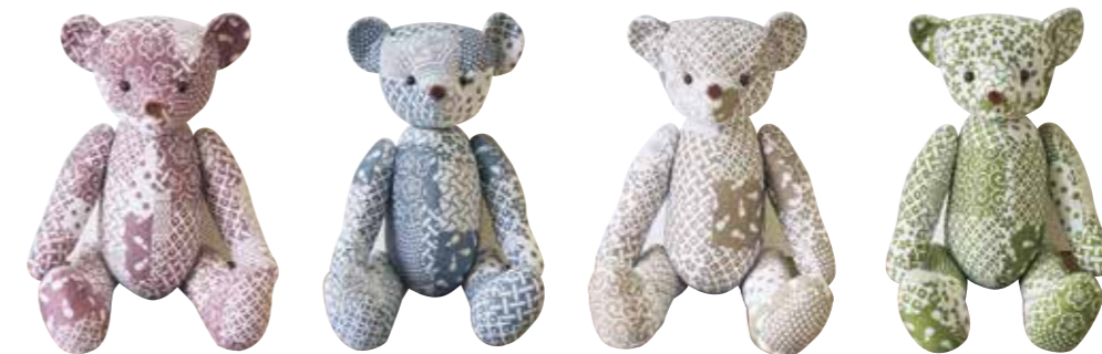
ピンク ブルー ベージュ グリーン

縁起のいい小紋柄をパッチワーク風デザインで織り上げ、パールカラーのテディベアを作りました。一体一体ハンドメイドで製作、柄の出方や表情、体つきにも個性があります。結婚のお祝いや出産祝い、記念日の贈り物に人気です。