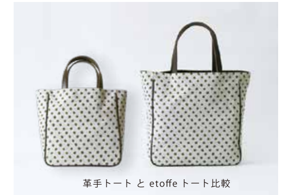
革手トートと étouffe トート比較

本革の持ち手を使った、小ぶりながらマチが大き く大容量のトートバッグ。マグネットホック開閉、 étouffeトートと同じく、表地の裏面に軽量のPVC 加工を施しています。